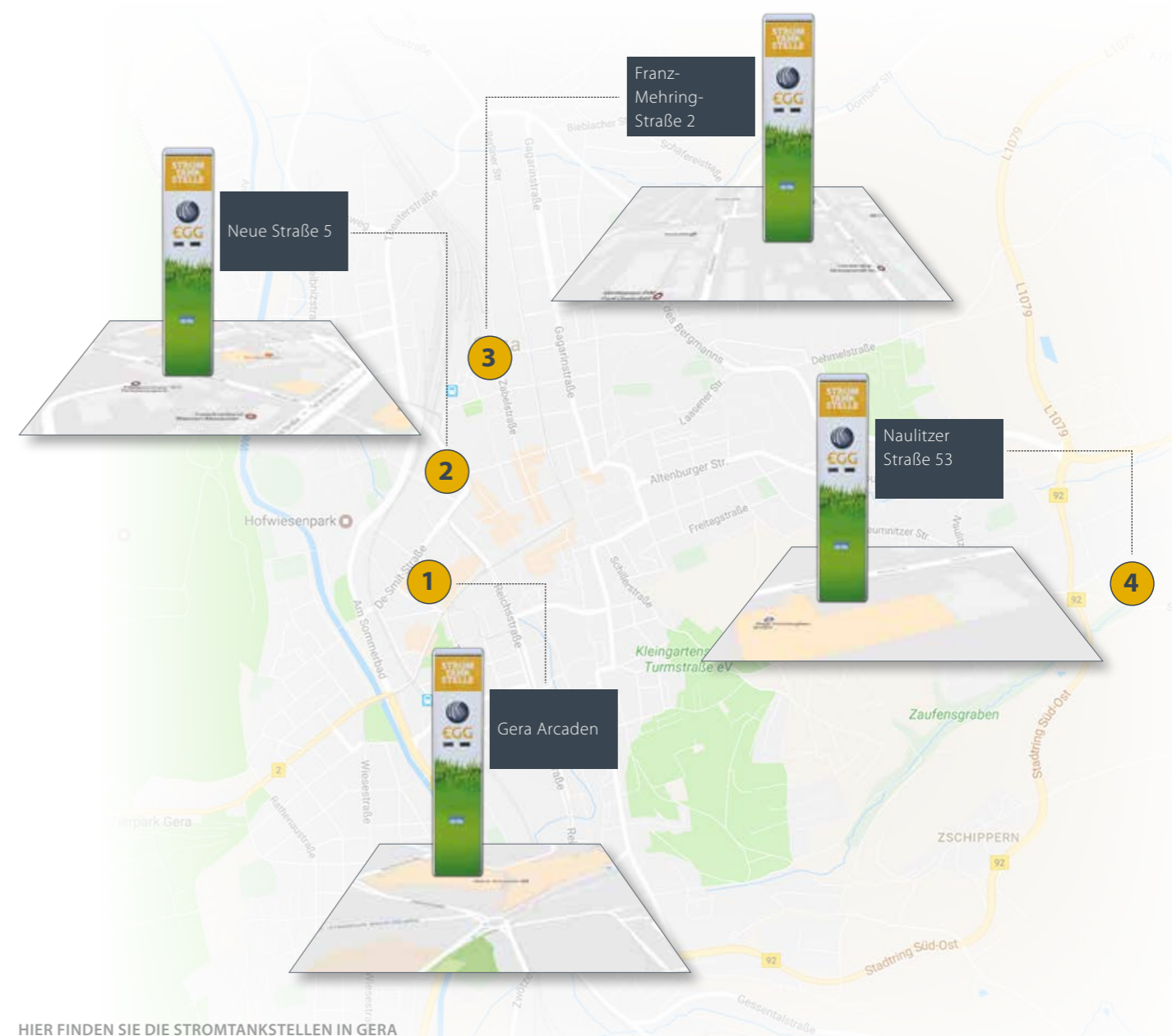
HIER FINDEN SIE DIE STROMTANKSTELLEN IN GERA

Eine Sonderlösung ist der Tesla-Supercharger mit 120 kW Gleichstromladung. Die Ladung mit einem haushaltüblichen Schutzkontaktstecker dauert z. B. für eine 22 kWh Batterie ca. 8 Stunden. An einer der modernen Schnellladestationen wird die Batterie