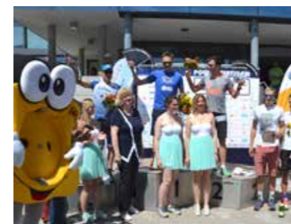
EGGI SORGT AUCH 2017 WIEDER FÜR HÖCHSTLEISTUNGEN BEI ATHLETEN UND ZUSCHAUERN

EGG engagiert bei Geras größtem Sportereignis