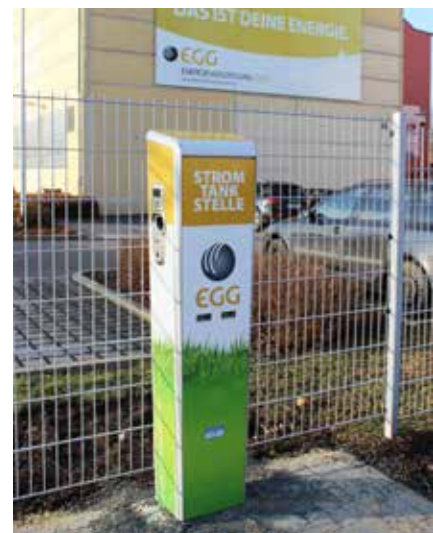
STROMTANKSTELLE IN DER NEUEN STRASSE

Bei der E-Mobilität sind die einen der Meinung, es brauche zu allererst mehr leistungsfähige Elektrofahrzeuge zu fairen Preisen. Die anderen wiederum sind der festen Überzeugung, vorher müsse ein entsprechendes Netz an E-Tankstellen realisiert werden, um die Nutzung von Elektrofahrzeugen und somit deren Entwicklung und Produktion attraktiver zu machen. Diese Diskussion könnte ewig fortgesetzt werden und die Erreichung der Klimaschutzziele auch dadurch in weitere Ferne rücken. Oder aber es wird gehandelt.