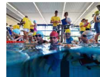
TRIATHLON AUCH BEI KINDERN UND JUGENDLICHEN IMMER BELIEBTER