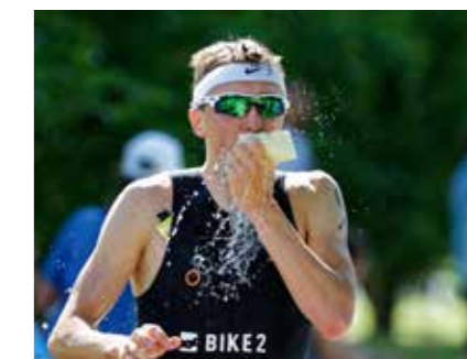
NEUE LAUFSTRECKE MIT ZUSCHAUERTRIBÜNE WIRD LÄUFER ZUSÄTZLICH MOTIVIEREN

Am 21. Mai 2017 lockt Geras bekannteste Sportveranstaltung abermals hunderte Athleten und über 5000 Zuschauer in den Hofwiesenpark. Dann gibt es wieder spannende Wettbewerbe – und mittendrin die EGG.