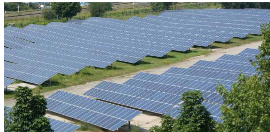
4.900 SOLARMODULE IN DER GASWERKSTRASSE ERZEUGEN ÖKOSTROM

Die EGG wurde Anfang Februar dieses Jahres vom Thüringer Ministerium für Umwelt, Energie und Naturschutz als „Energiegewinner Thüringens“ ausgezeichnet. Der Solarpark Gaswerkstraße ist nun Teil der thüringenweit ausgezeichneten Best-Practice-Beispiele der Energiewende.