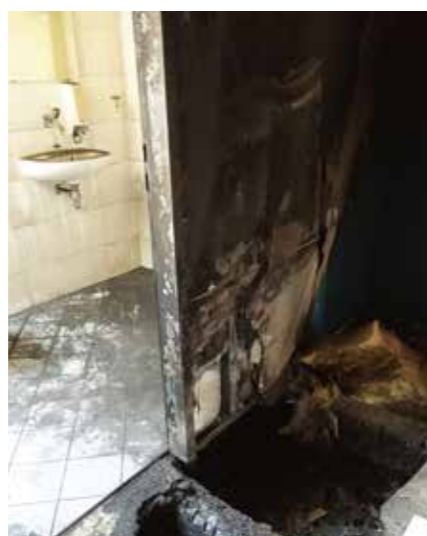
BRANDSTIFTER VERURSACHEN IMMENSEN SCHADEN.

Nun hoffen alle, dass die letzten Planungstätigkeiten zügig abgeschlossen werden, und ab Mai die Handwerker ihre Arbeit aufnehmen können. Dann könnten 25 Jahre Streetwork-GERA e.V. im Oktober wieder in der Kontaktstelle im Bärenweg gefeiert werden.