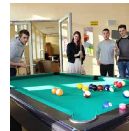
STUDENTEN DER DHGE WEIHEN NEUEN BILLARDTISCH EIN.

Am 16.02.2017 konnte nun eine kleine Delegation der DHGE-Studenten den stabilen Billardtisch im Studentenclub in der Tonhalle erstmals einspielen.