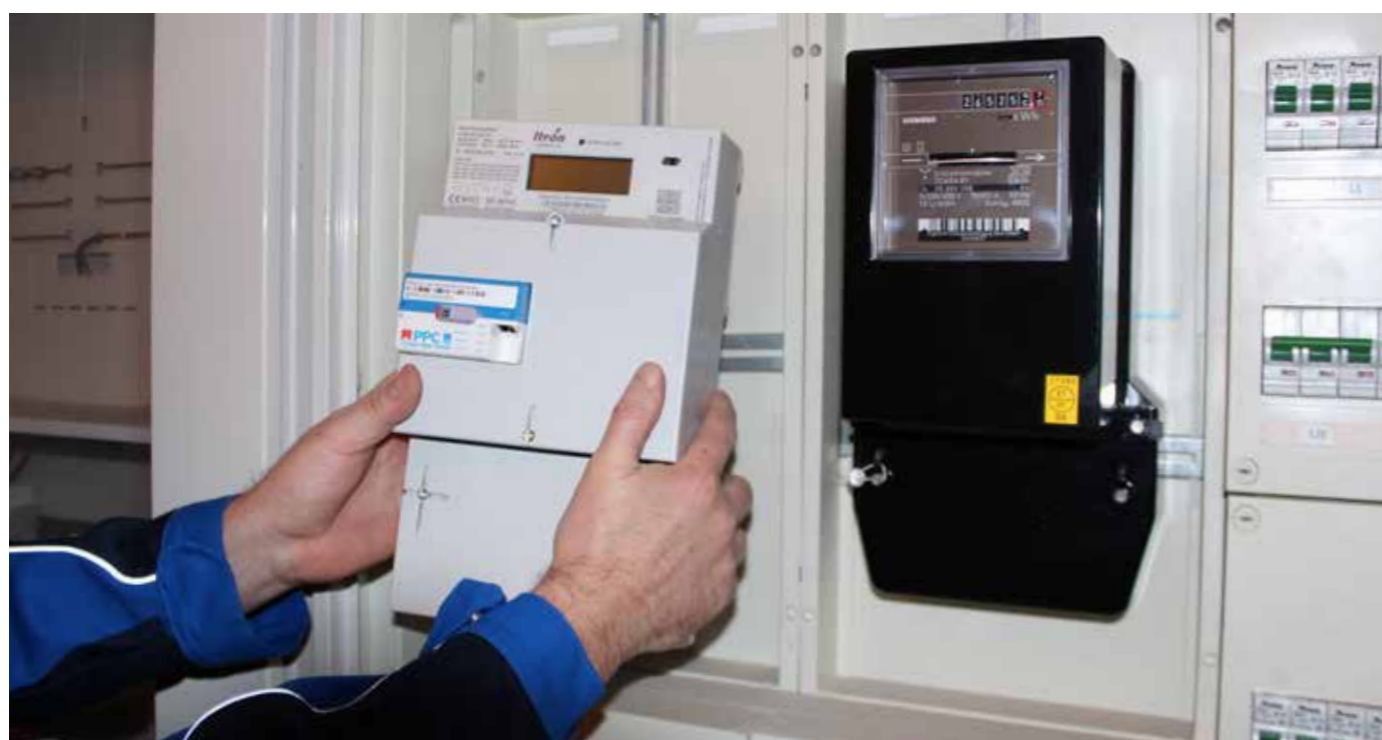
DIGITALE MESSTECHNIK ERSETZT DIE MECHANISCHEN FERRARISZÄHLER

Zum anderen kann der Netzbetreiber eine größere Stabilität des Stromnetzes erreichen. Das ist nicht nur langfristig ressourcenschonender für das Stromnetz sondern kann ebenso zu einer effizienteren Auslastung der Netze genutzt werden.