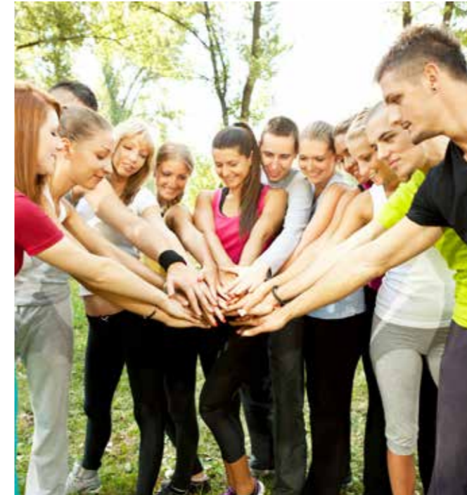
UNSERE ENERGIE FÜR IHR PROJEKT

EGG fördert sechs Geraer Projekte mit Mitteln aus Sozial- und Umweltfonds 2017