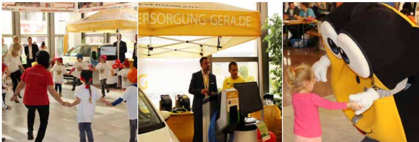
IMPRESSIONEN VOM FAMILIENTAG DER WOHNUNGSBAUGENOSSENSCHAFTEN GERAS

EGG mit Elektromobilität beim Familientag der WIR!