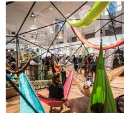
ENTDECKEN UND AUSPROBIEREN

FERN.licht – Die Erlebnismesse für Reisen, Outdoor und Fotografie am 25. & 26.11.2017 in Leipzig