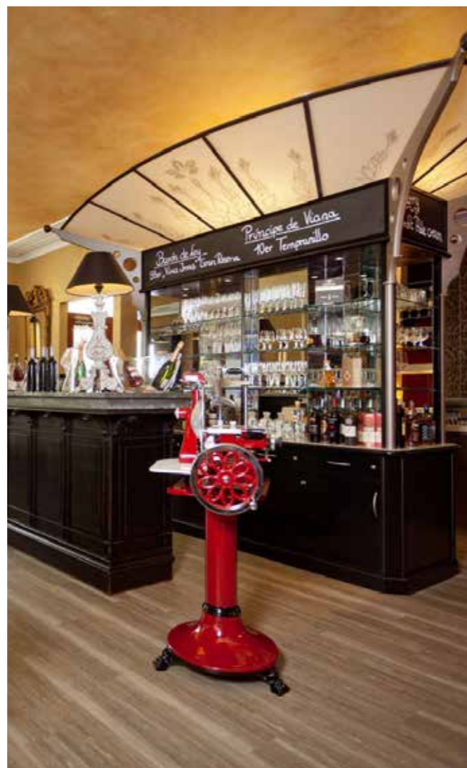
TAPAS UND WEIN IM MEDITERRANEN AMBIENTE IM „LA BODEGA“

Nur einen Steinwurf entfernt wird wahres südeuropäisches Flair geboten. In der La Bodega, dem Tapas & Vino Restaurant, gibt es neben einer Auswahl spanischer Weine, verschiedene Tapas sowie mediterrane Fisch- und Fleischgerichte. Als Empfehlung sei die Tapas-Etagere mit verschiedenen Appetithäppchen für zwei