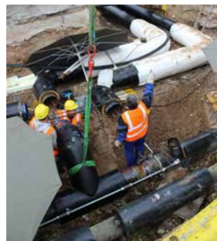
VERBINDUNG DER HEISSWASSERTRASSEN (MITTE SEPTEMBER)

2017 bis 2019 kontinuierlich ausgebaut werden. Wenn dann Ende 2018 das HKW-Lusan und auch das HKW-Tinz ans Netz gehen, werden die alten oberirdischen Dampfrohre nicht mehr gebraucht. Über Jahrzehnte hinweg waren sie in Gera präsent. 2019 gehen die letzten ihrer Art vom Netz und werden innerhalb der folgenden zehn Jahre vollständig aus dem Stadtbild Geras verschwinden.