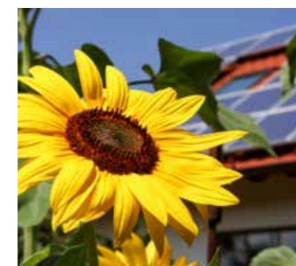
FÜR MEHR STROM AUS SONNENENERGIE