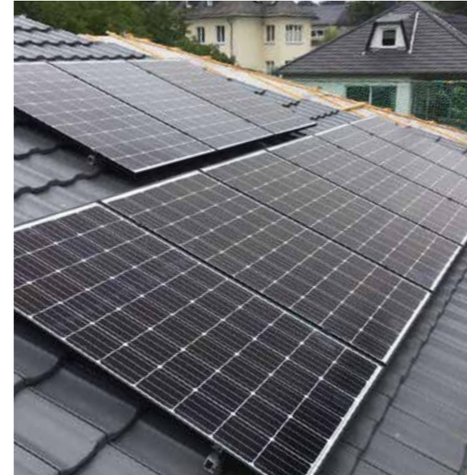
18 HANWHA Q-CELLS SOLARMODULE WURDEN VERBAUT

EGG unterstützt Ausbau privater Photovoltaikanlagen