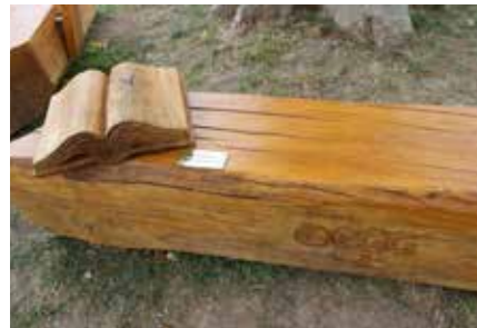
EIN BUCH AUS HOLZ GESCHNITZT ALS SYMBOL AUF EINER DER FÜNF HOLZBÄNKE

Individuell gestaltete Marcus Malik die Sitzmöbel und konnte sogar das gewünschte Buch aus Holz umsetzen. Dieses ist auf einer der Bänke angebracht und verdeutlicht die Idee, die hinter dem Projekt des Fördervereins Buch & Leser e.V. steckt: Die sinnvolle Nutzung eines lauschigen Plätzchens mitten im Zentrum Geras als einen Ort zum Verweilen, Ausruhen und vor allem zum Lesen von Büchern. Diese müssen dafür nicht selbst mitgebracht werden. Leserinnen und Leser können sie aus dem öffentlich zugänglichen Bücherschrank direkt unter dem Baum aussuchen.