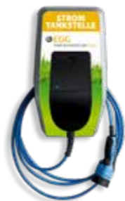
WALLBOX DER MARKE MENNEKES

unterschiedliche Kundenbedürfnisse die passenden Ladeboxen. Alle Wallboxen können problemlos in einer Garage oder an einem Carport angebracht oder mit Hilfe einer freistehenden Edelstahlsäule befestigt werden. Möchten Sie sich neben der Ladetechnik auch einen günstigen Tarif für das Laden zu Hause und an den öffentlichen Stromtankstellen im Lade-netz-Verbund sichern? Dann ist unser Ladepaket „Gera E-Mobil“ das Richtige für Sie! Neben einer vergünstigten Wallbox erhalten Sie den aus 100 % Ökostrom erzeugten Tarif Gera E-Mobil sowie eine EGG-Ladekarte, mit der Sie an allen Stromtankstellen im Lade-netz-Verbund zum gleichen günstigen Preis wie zu Hause Strom tanken