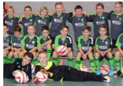
JUNIOREN-FUSSBALLER DES SG BRAUNSCHWALDE 1898 E.V. BEKAMEN IN DIESEM JAHR NEUE TRIKOTS SPENDIERT.

Bewerbungen bitte an: magazin@energieversorgung-gera.de oder Energieversorgung Gera GmbH, Marketing, Postfach 1150, 07501 Gera.