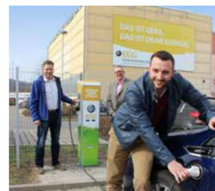
UMFORMERSTATION (HINTEN) UND STROMTANKSTELLE (VORN) NEUE STRASSE 5

In der Dampf-/Wasser-Umformstation wird die technische Funktionsweise erläutert, bei der Heißdampf in Heißwasser umgewandelt wird. Außerdem erhalten Sie Einblick in das Projekt „Neuaufstellung der Fernwärmeversorgung“ mit Erläuterung der zukünftig geplanten Erzeugungsstruktur in Gera.