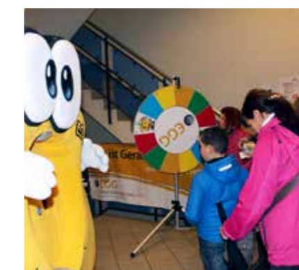
UNSER EGGI ALS GLÜCKSBINGER

Welche Farbe hat Strom? Womit fährt ein elektrisches Auto? Und woraus wird erneuerbare Energie gewonnen? Wenn Sie und Ihre Kinder diese oder ähnliche Fragen beantworten können, haben Sie beste Chancen, beim EGG-Glücksrad einen attraktiven Preis zu gewinnen.