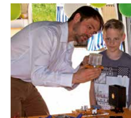
EXPERIMENTIEREN UND ENTDECKEN

Kinder experimentieren. Ein geschulter Referent steht zur Unterstützung bereit und beantwortet Ihre Fragen.