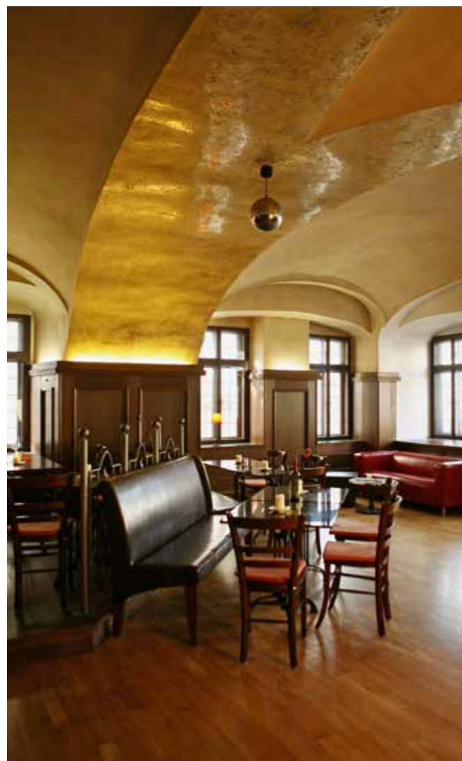
URGEMÜTLICH ESSEN UND TRINKEN IM „MARKT 1“

Die Markt-Restaurants in Geras historischem Zentrum