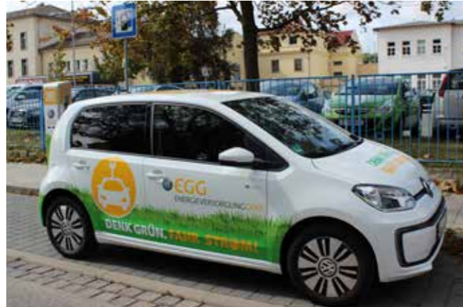
DER NEUE E-UP! (STROMTANKSTELLE NAHE DEM HAUPTBAHNHOF)

EGG mit E-Fahrzeug im Einsatz, weitere Stromtankstellen in Gera in Planung