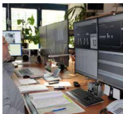
ALLES IM BLICK – DIE EGG-NETZLEITSTELLE

ALLE AKTIONEN FINDEN AN UNSEREM STANDORT NEUE STRASSE 5 STATT.