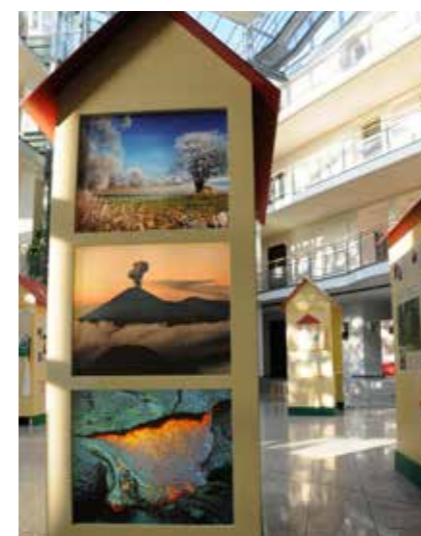
INFORMATIVE AUSSTELLUNG ZUR ENERGIEEFFIZIENZ

Intelligente Messsysteme und Smart Meter sind die Zukunft. Lassen Sie sich die Funktionsweise der neuen Technik erklären und erleben Sie, wie die drahtlose Übermittlung von Messwerten funktioniert.